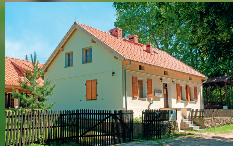
Muzeum Michała Kajki w Ogródku, 2014 r.