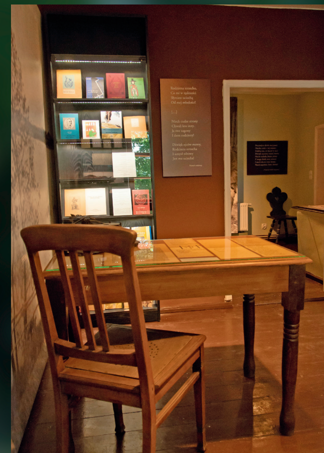
Muzeum Michała Kajki w Ogródku – część wystawy, 2014 r.