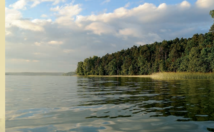
Wschodni brzeg Jeziora Mokrego

Po dwóch kilometrach, dochodząc do Jeziora Mokrego, mijamy pole namiotowe dla kajakarzy. Tu można odpocząć przy pomoście. Jezioro Mokre (814,78 ha) jest typowym jeziorem rynnowym, ukształtowanym przez przesuwający się lodowiec. Jezioro otocz- one jest wałami moren czołowych, których wysokość względna na brzegu wschodnim dochodzi do 35 m. Mokre jest jeziorem me- zotroficznym (pośrednie między ubogim a żynym) o głębokości 51 m, zasobnym w rybę z rodziny łośosiowatych - sielawę. Od po- mostu droga skręca na południe wzdłuż jeziora i lasów mieszanych z dominującą sosną i dębem.