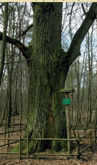
Pomnik przyrody „Dąb Krutyński”