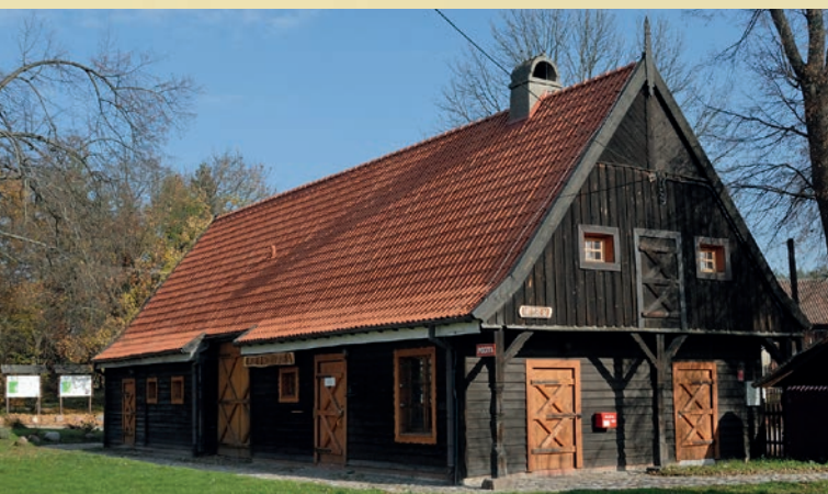
Zabytkowa stodoła mazurska

Za mostem, po prawej stronie znajduje się budynek (dawne Nadleśnictwo Krutyń), w którym w 1963 r. zatrzymał się noblista John Steinbeck. Dom ten wzniesiono na miejscu dworku my- śliwskiego służącego w XVI w. Albrechtowi Hohenzollernowi jako schronienie przed dżumą.