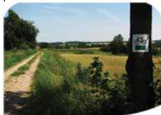
Nasyp kolejki wąskotorowej w Popowie

Skrzyżowanie (Y) z drogą do Młynowa. Skręcamy najpierw w prawo w kierunku Młynowa, by po paru metrach skręcić w lewo. Wjeżdżamy na drogę szutrową. Jest to ponownie nasyp wąskotorówki. Dojeżdżamy do skrzyżowania dróg gruntowych, skręcamy w prawo i jedziemy dalej nasypem.