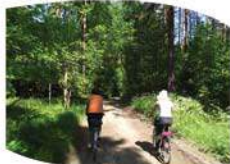
Szlak w Lasach Sorkwickich

Wyjazd na teren zalesiony. Szlak skręca w prawo, w głąb lasu, w jedną z gruntowych dróg. Początkowy odcinek (podjazd) piaszczysty. Rozwinięcie dróg odnoga (Y). Szlak wiedzie lewą odnogą. Leśna droga gruntowa. Skrzyżowanie dróg leśnych. Szlak wjeżdża na drogę, którą jedziemy aż do Bagieniec Małych. Wyjazd z lasu, szlak wiedzie drogą wśród pól i łąk. W oddali widać wieś.