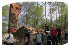
Ruiny zamku krzyżackiego w Szestnie

Dojeżdżamy do osiedla bloków, szlak wiedzie prosto. Dojeżdżamy do szosy w kierunku Mragowo – Kętrzyn (trasa nr 591) i skręcamy w prawo.