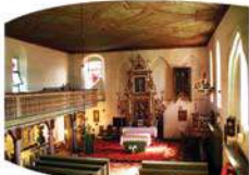
Wnętrze zabytkowego kościoła w Szestnie

Został wzniesiony w XV wieku. W latach 1525-1980 parafia luterańska, obecnie katolicka. Świątynia została zniszczona w wyniku pożaru w 1618 roku. Do 1639 roku odbudowana w obecnym kształcie o charakterze obronnym. Wieża to najstarsza część kościoła. Mury pierwszej kondygnacji o grubości 2 metrów i niewielkie otwory okienne miały ochraniać obrońców. Przepiękne architektoniczne szczegóły w stylu romańskim znajdujące się w górnej kondygnacji po stronie południowej wieży są unikalne na terenie Mazur. Budowla zwieńczona jest krzyżem jerozolimskim.