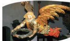
Unikalny aniot chrzcielny z Sorkwit

1701 r., późnorennesansowa łoża patronacka z ok. 1615 r., barokowy krucyfiks, konfesjonat z 1702 r. i organy z 1875 r.