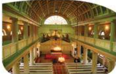
Wnętrze kościoła ewangelickiego

Ciekawym zabytkiem jest klasycystyczny kościół ewangelicki z 1840 - 42 r. Wystrój wnętrza jest skromny, jak w większości świątyń ewangelickich, ale bardzo elegancki. Ambona umieszczona nietypowo, bo zamiast ołtarza. Uwagę zwraca sklepienie kolebkowe ozdobione kasetonami, drewniane empy. Wieżę wybudowano w 1880 r