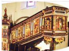
Pięknie rzeźbiona balustrada z ambony

Ambona pochodzi z 1625 roku. Została ona ufundowana jako pierwsza rzecz nowego wyposażenia kościoła. Należy przypuszczać, podobnie jak i w przypadku ołtarza, że jest o wiele starsza, a w roku 1626 została odnowiona. Ambona ma kształt pięciokąta i ukazuje w przedgodach czterech ewangelistów wyrzeźbionych w drewnie.