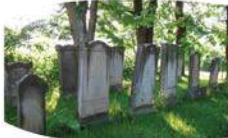
Kirkut w Mikołajkach

Pl. Kościelny tel. +48 87 421 68 10 godz. otw. 9.00 - 17.00 bilety: norm. 5 zł ulg. 3 zł