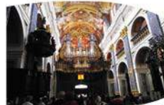
Freski oraz organy świętołipskie

Niedziele i święta: 10.00, 12.30, 13.30, 15.30, 16.30 Dni powszednie: 9.30, 10.30, 11.30, 13.30, 14.30, 15.30, 16.30, 17.30 W soboty po południu prezentacje mogą być odwołane, jeżeli w Bazylice ma miejsce ślub.