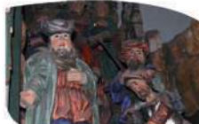
Mieszkańcy Sorkwit na ołtarzu głównym

We wnętrzu uwagę zwraca ołtarz i jedno z najbardziej oryginalnych przedstawień Wniebowstąpienia - z umieszczonego na suficie obrotu wystają tylko nogi Jezusa. Część centralna przedstawia Golgote , w którą wkomponowano elementy charakterystyczne dla Sorkwit : postacie rybaków, pałac właścicieli Sorkwit i patronów kościoła.