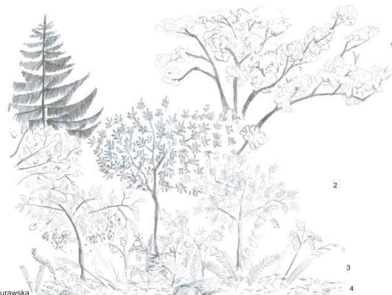
Rys. E. Murawska

Spróbuj nazwać piętra roślinności występujące w lesie