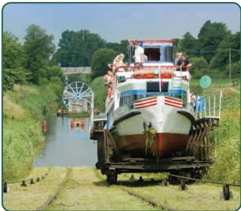
Kanał Elbląski, pochylnie

Przygoda, nauka, refleksja – to wszystko czeka na tych, którzy ruszą tym niepowtarzalnym szlakiem.