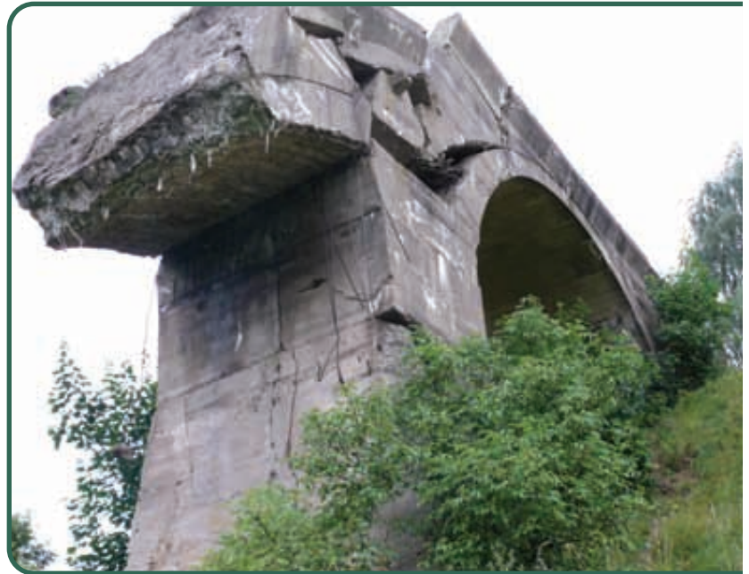
Krukłanki, most kolejowy wysadzony w zawierusze wojennej w 1945 r.