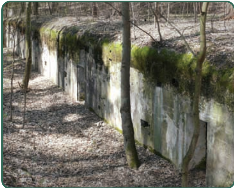
Grzybowo, schrony Giżyckiej Pozycji Polowej

obronę terenu nawet w okrążeniu. Przed 1914 rokiem powstała także Szczycieńska Pozycja Leśna. Starsze założenia obronne włączano w nowe plany, a niektóre fortyfikacje modyfikowano i użytkowano aż do 1944 roku.