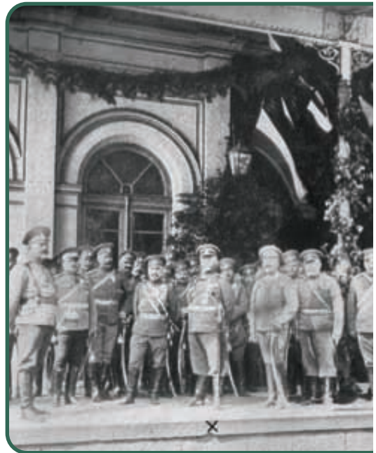
Gen. Rennenkampf i sztab armii rosyjskiej, 1914 r.