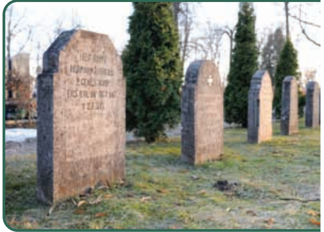
Etłk, kwatery żołnierzy z I wojny światowej fot. P. Dobrzyński

Etłk – najbardziej reprezentacyjną i najlepiej zachowaną nekropolią wojenną Etłku jest sektor wojenny cmentarza komunalnego przy ul. Cmentarnej. Znajduje się tu 136 imiennych mogił żołnierzy niemieckich, a wśród nich dowódcy 33 Brygady Landwehry. Mogiłom towarzyszy okazała kamienna kolumna pamiątkowa zwieńczona krzyżem maltańskim. Na cmentarzu wojennym przy ul. 11 Listopada pochowano 82 bezimiennych żołnierzy rosyjskich. Na cmentarzu przy ul. Kajki położona jest kwatery wojenna, w której spoczywa 9 lub 10 żołnierzy niemieckich. Kolejna zbiorowa mogiła zachowała się na terenie szpitala wojskowego. Przy ul. Kolejowej, na obszarze dzielnicy Szyba, znajdziemy cmentarz wojenny, na którym spoczęło 109 nieznanych żołnierzy rosyjskich. Na skwerze przy ul. 3 Maja odrestaurowano miejsce, w którym ustawiony był pomnik