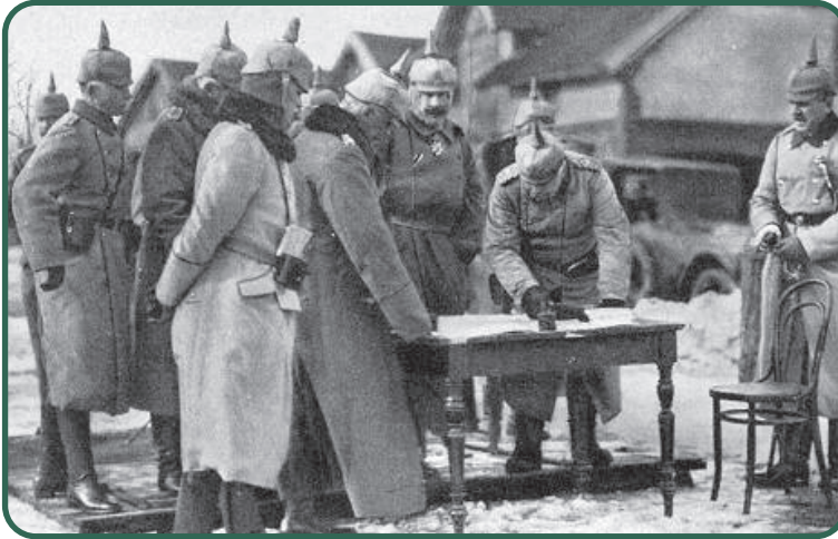
Cesarz Wilhelm II pod Elkiem