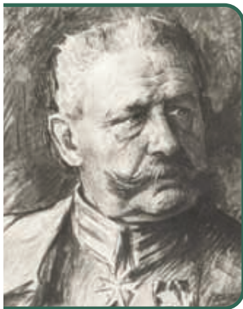
Marszałek Hindenburg

Do pierwszej bitwy na terenie Prus doszło 17 sierpnia pod Stołupianami. Bitwa ta, mimo iż wygrana przez wojska niemieckie, nie powstrzymała dalszego marszu armii rosyjskich. Wykazała jednak największe słabości rosyjskiego ataku, a mianowicie nieumiejętność koordynacji działań własnych wojsk i słabą komunikację między dowódcami. Trzy dni później doszło do bitwy pod Gąbinem. Choć nie przyniosła ona zdecydowanego rozstrzygnięcia, uważana jest za zwycięską dla armii rosyjskiej. Wojska niemieckie zadały Rosjanom potężne straty, nie zatrzymały jednak ich marszu na zachód. Po tej bitwie odwołano dowodzącego wojskami niemieckimi gen. Maximiliana von Prittwitz und Gaffron, zastępując go generałem Paulem von Hindenburgiem. Pod jego dowództwem armia niemiecka stoczyła największą batalię w kampanii wschodniopruskiej – bitwę pod Tannenbergiem (pol. Stębark). Bitwa trwała od 23 do 31 sierpnia. Rosja poniosła dotkliwą klęskę. Mimo przewagi liczebnej straciła