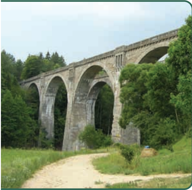
Staćzyki, wiadukty

infrastruktury komunikacyjnej, których przykładami mogą być: 100-letnia Etcka Kolej Wąskotorowa, wiadukty w Stańczykach (najwyższe w Polsce) czy Kanał Elbląski (najdłuższy kanał żeglowny w Polsce).