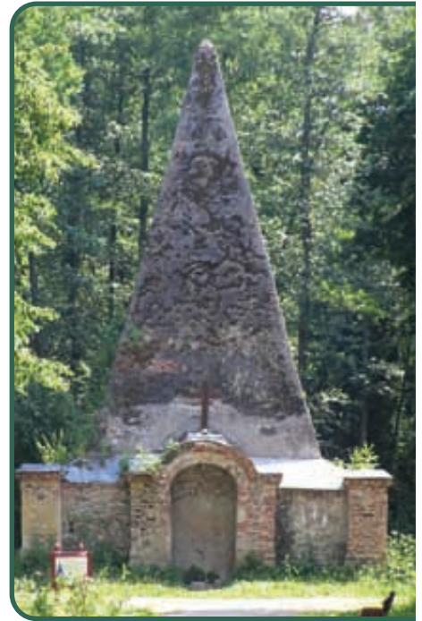
Rapa, piramida Fahrenheitów