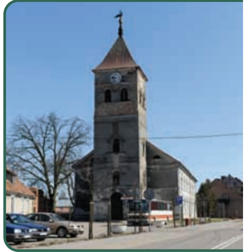
Wielbark, dawny kościół ewangelicki

Szymany – na ścianie miejscowej świątyni poewangelickiej wisi ufundowana w 1924 roku tablica pamiątkowa z nazwiskami poległych mieszkańców Szyman i okolicznych wsi.