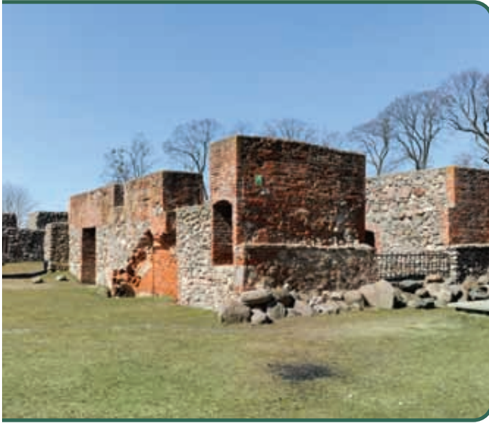
Ruiny zamku krzyżackiego w Szczytnie

strefa Wielkich Jezior, uniemożliwiająca nacierającej armii szerokie manewry, ale także specjalnie chronione przed wycinką puszcze Piska, Romincka i Borecka, nie pozwalały na przemarsh dużych jednostek wraz z zaopatrzeniem i sprzętem, jak również na podejście do głównych miast z niebronionej flanki. Najlepszym połączeniem fortyfikacji z uwarunkowaniami terenu jest Pozycja Jezior Mazurskich – na linii Bogaczewo (nad jeziorem Niegocin) – Mikołajki – Ruciane-Nida. Linie obronne rozbudowywano także w czasie I wojny światowej. Giżycką Pozycję Polową ukończono w 1917 roku. Składała się ona z 255 umocnień zamykających przejścia między jeziorami, z Giżyckiem w centrum. Pozwalała na