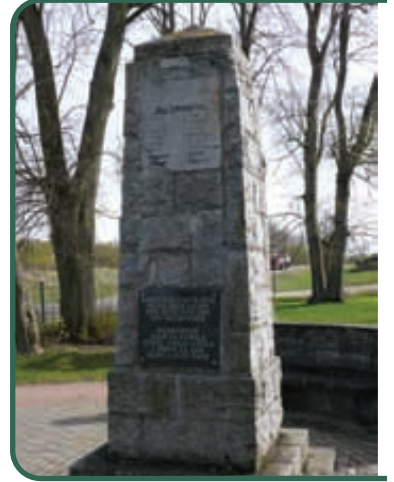
Szymonka, obelisk

Giżycko – to bez wątpienia miasto najbogatsze w ślady z okresu I wojny światowej. Na cmentarzu wojennym przy jeziorze Popówka Mała spoczęło 243 żołnierzy niemieckich i 175 rosyjskich, ale także trzech Belgów, Turek i dwóch Rumunów. Na starym cmentarzu komunalnym przy Placu Targowym zlokalizowana jest zbiorowa kwatera wojenna, w której pochowano 264 żołnierzy niemieckich i 17 rosyjskich. W miejscu tym ustawiono ogromny głaz z tablicą pamiątkową. Na terenie tzw. Lasu Miejskiego zachowała się podstawa pomnika wojennego poświęconego żołnierzom 82 (2 Mazurskiego) Pułku Artylerii Polowej. Konsekwentnie w 1938 roku kościół św. Brunona w założeniu był kościołem pamięci niemieckiego czynu wojennego na froncie wschodnim (niem. St. Bruno-Gedächtniskirche). Kluczowym elementem przypominającym wydarzenia 1914 i 1915 roku jest jednak Twierdza Boyen. Ten, wzniesiony na przesmyku pomiędzy jeziorami Niegocin, Kisajno i Tajty, artyleryjski fort zaporowy z II poł. XIX w., odegrał kluczową rolę podczas walk pomiędzy sierpniem 1914 a lutym 1915 roku. W początkowym okresie skuteczna obrona twierdzy umożliwiła stronie niemieckiej wykonanie głębokiego manewru przerzutu wojsk, co zakończyło się zwycięstwem pod Tannenbergiem. Następnie Giżycko stało się punktem wyjścia dla manewru oskrzydającego podczas I bitwy nad jeziorami mazurskimi. W okresie zmagania zimowych twierdza była głównym punktem oporu całego frontu mazurskiego.