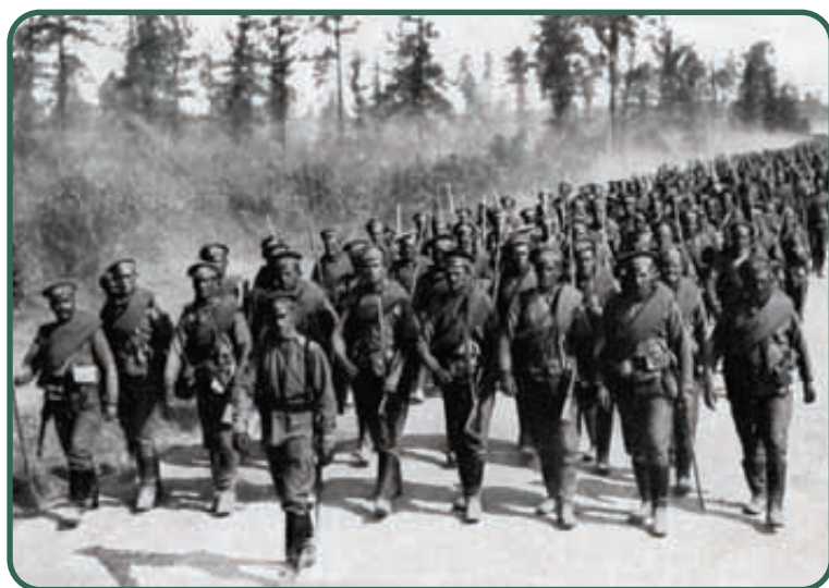
Oddziały rosyjskie w trakcie przemarszu