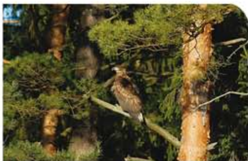
Писская пуща.

В одном из многочисленных ресторанов рекомендуем мазурскую рыбу, а также покупки на местном базаре. Стоит прокатиться по реке Крутыни мазурской плоскодонкой. Действительно, это один из самых привлекательных аттракционов в регионе.