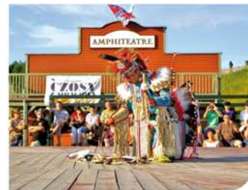
Вестерновый Городок "Mrongoville". Фот. M.Modzelewski

В Мронгово рекомендуем посетить Вестерновый Городок «Mrongoville» . Только в нем почувствуете неповторимый климат Дикого Запада! Великолепная забава, незабываемые впечатления и развлечения для всех! Индейская Деревня, Ранчо Фермера, офис Шерифа с камерой предварительного заключения; можно посмотреть старинный локомотив, кладбище, где похоронены наиболее опасные преступники Дикого Запада! В Салооне можно отведать блюда кухни Дикого Запада и ковбойские напитки. Гарантируем отличную забаву и много юмора! Приезжайте в Мронгово в любое время года!