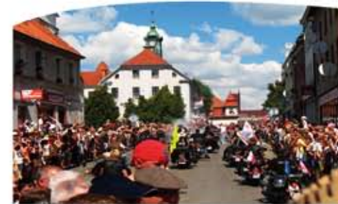
Мронгово - фестивальный город