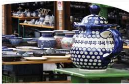
Рынок в Крутыни