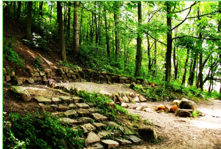
Źródło Miłości nad j. Czos

Ścieżka rozpoczyna się przy mrągowskim amfiteatrze, a kończy przy Źródle Miłości. Na trasie 10 tablic edukacyjnych. Źródło Miłości to znany cel spacerów. Źródło wypływa tuż nad brzegiem jeziora. Są tu ławeczki, gdzie można odpocząć,