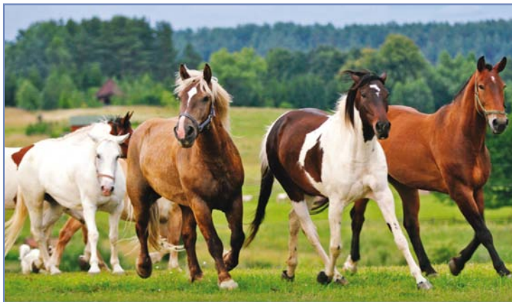
Stadnina koni Fundacji Eulalii

Ponadto: prowadzona jest nieodpłatna hipoterapia dla dzieci z porażeniem mózgowym, spotkania