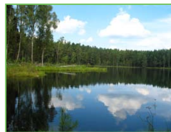
Leśne jezioro w okolicach Krutyń

Ścieżka prowadzi z miejscowości Krutyń przez rez. Krutynia, wzdłuż brzegu rzeki, do j. Krutyńskiego. W rezerwacie spotkać można zimorodki, trzecie nurogęsi, łabędzie, wydry, norki amerykańskie oraz poznać rośliny runa leśnego: konwalijkę dwulistną, konwalię majową, kokoryczkę wonną i wielokwiatową, skrzyp zimowy i inne. Przystanki: Rzeka Krutynia; Czerwone kamienie; Żółty piasek; Meandry Krutyń; Zgryzy bobrowe; Las nad Krutynią; Stary most; Fauna rezerwatu. Administrator: Mazurski Park Krajobrazowy, 11-710 Piecki, tel. 89 742 14 05, www.mazurskipark.pl