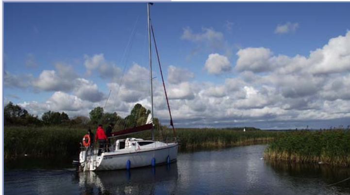
W Popielnie w kierunku Śniardw

Oferta: nauka nurkowania, nurkowanie z osobami niepełnosprawnymi