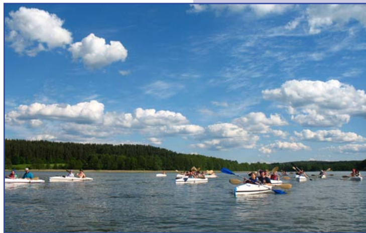
Jezioro Juno na szlaku Dajny

ul. Traugutta 4b, 11-700 Mrągowo, tel. 89 741 37 21, 609 311 675, www.kanu-mragowo.pl