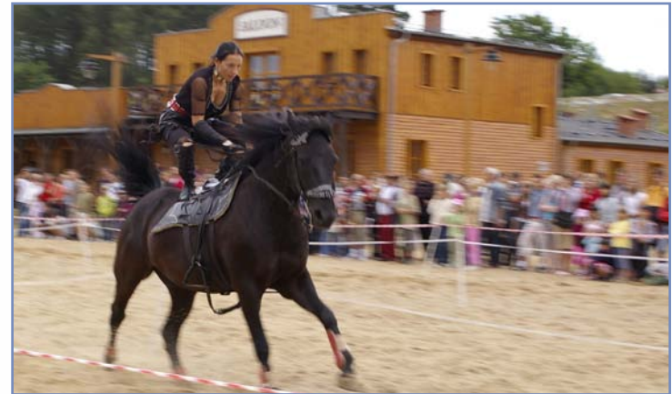
Konne pokazy w Mrongoville

Borowski Las 1, 11-731 Sorkwity, tel. 89 742 73 37, 601 685 646, www.zielonykon.pl