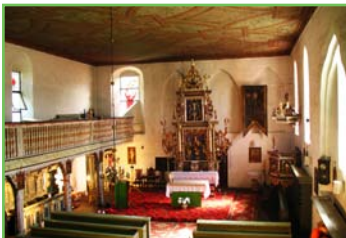
Kościół w Szesznie

Na trasie znajduje się sporo ciekawych miejsc: miasteczko westernowe Mrongoville , Słowicy Wąwóz z Diabelskim Kamieniem , stanowisko archeologiczne Czarny Las i ruiny nieistniejącej wsi. A na sam koniec perełka – niewielkie Szeszno z wieloma zabytkami. Wśród nich: dwór, ruiny jedynego w powiecie mrągowskim zamku i kościół z późnorenansowym wyposażeniem i zabytkowym cmentarzem.