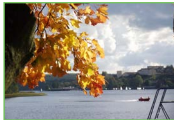
Jezioro Czos jesienią

Przebieg: Szlak prowadzi głównie brzegiem j. Czos do Góry Czterech Wiatrów. Spacerując nim mamy okazję podziwiać jezioro z innej perspektywy, mało znanej mieszkańcom i turystom - z drugiej strony miasta kierując się na Półwysp Czterech Wiatrów. Zachwyca las i jezioro z zatoczkami. Koniec szlaku to Całoroczny Ośrodek Sportowy „Góra Czterech Wiatrów”, skąd rozciąga się panorama na jezioro i miasto. W ośrodku restauracja.